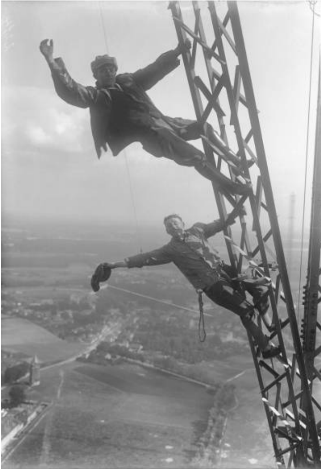
Arbeiter auf Funkturm bei Königs Wusterhausen, 1929 Bild 102-08325