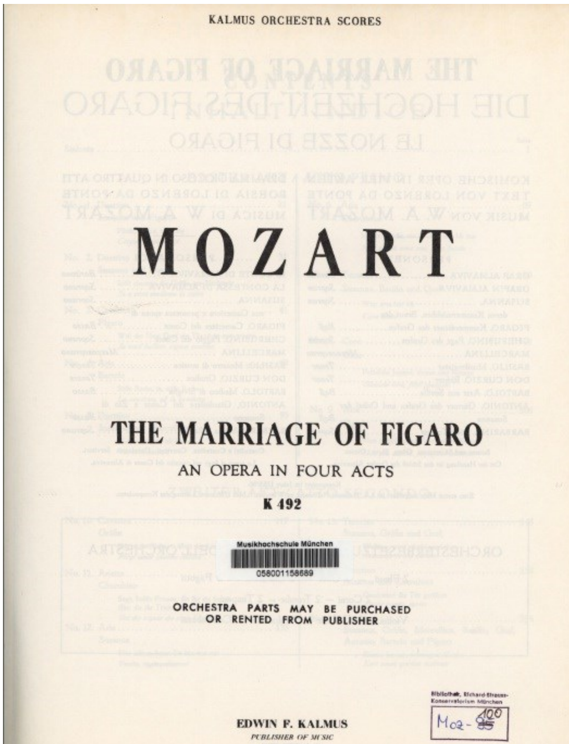
Abbildung 1 Partitur, Titelblatt