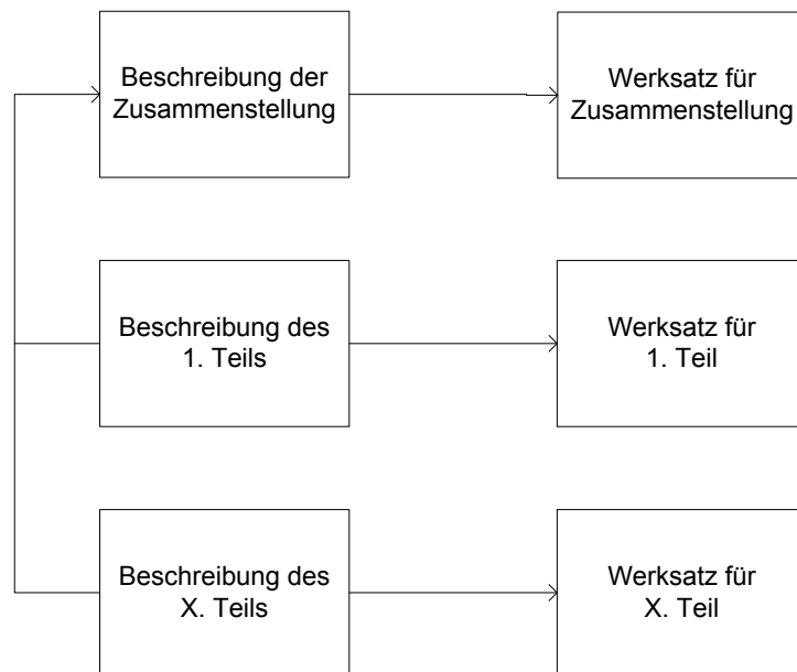
Schaubild hierarchische Beschreibung einer Zusammenstellung ergänzt um die Werkebene (beispielhaft illustriert anhand von Werksnormsätzen):

Nach RDA 17.8 ist stets nur das hauptsächlichste oder erstgenannte in der Manifestation verkörperte Werk erforderlich.