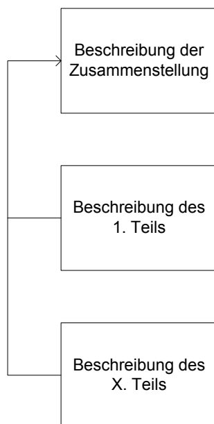
Schaubild hierarchische Beschreibung einer Zusammenstellung

Die hierarchische Beschreibung kann verwendet werden, um eine Ressource zu beschreiben, die aus mehreren - inhaltlichen oder physischen - Teilen besteht. Sie ist eine Kombination einer umfassenden Beschreibung des Ganzen (z. B. einer Zusammenstellung) und von analytischen Beschreibungen eines Teils oder mehrerer Teile (z. B. eines oder mehrerer in der Zusammenstellung enthaltener Aufsätze).